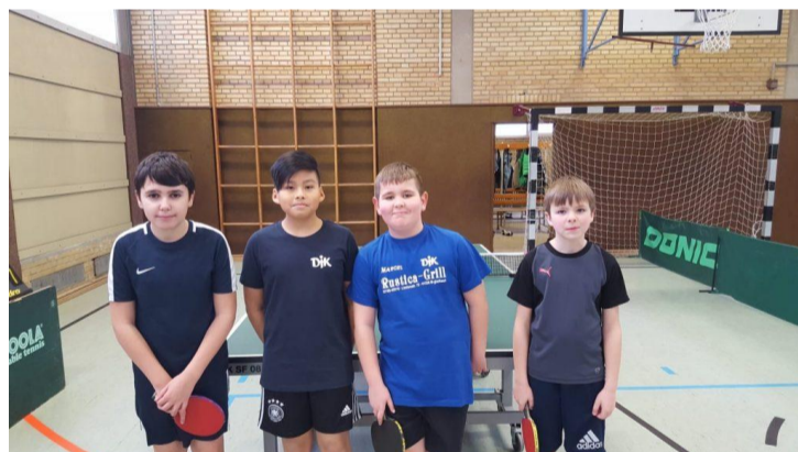
Schüler B 1 Saison 2018/19