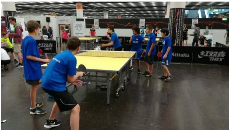
Unsere Jugend beim Rundlaufturnier WM 2018 in Düsseldorf