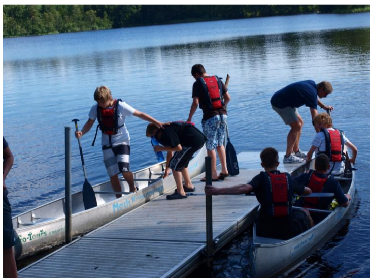
Kanutouren der Jugend und der Damen-Teams waren fast schon Tradition....